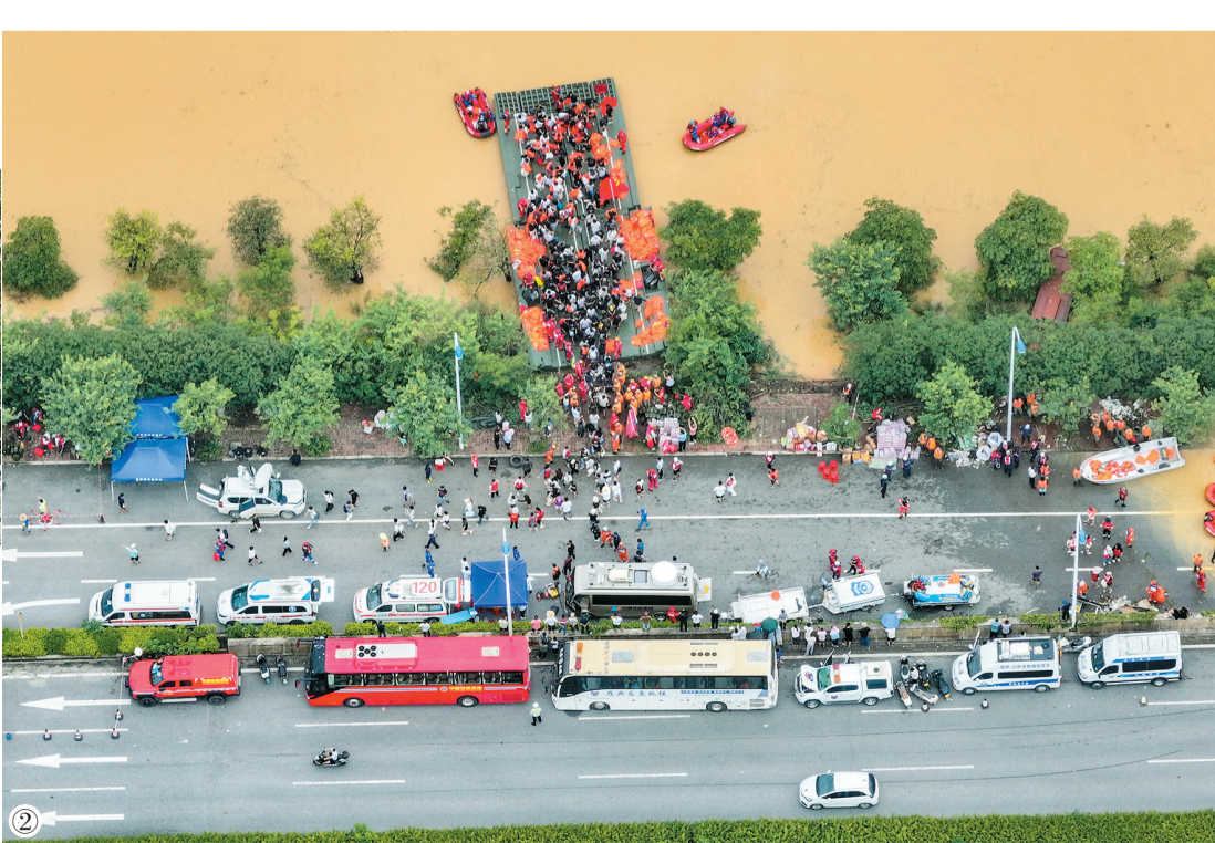
图②为7月9日,在广西贵港市西江教育园区,被困学生有序上岸(无人机照片)。