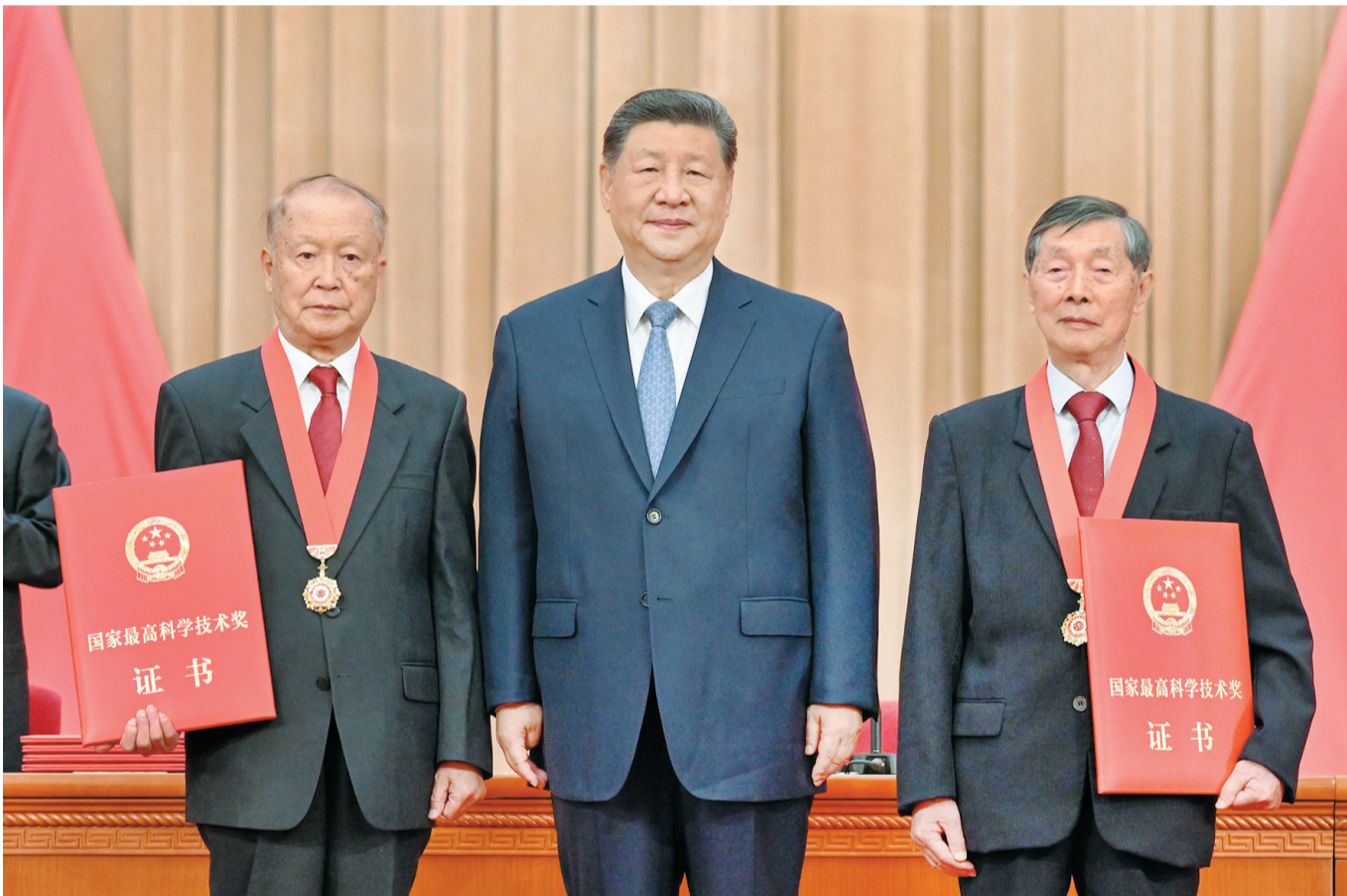
7月8日上午，国家科学技术奖励大会、中国科学院第二十二次院士大会和中国工程院第十八次院士大会、中国科学技术协会第十一次全国代表大会在北京人民大会堂隆重召开。中共中央总书记、国家主席、中央军委主席习近平向获得2025年度国家最高科学技术奖的中国科学院物理研究所陈立泉院士(右)和中国电子科技集团第十四研究所贾德院士(左)颁奖。