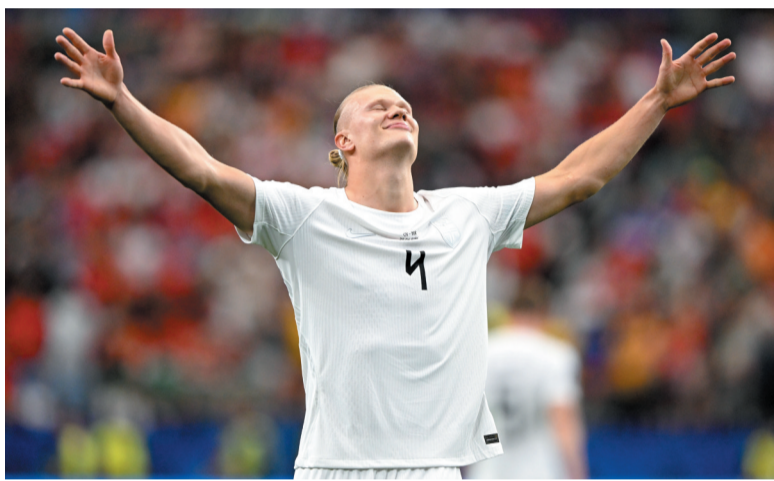
6月30日，在美国达拉斯体育场进行的2026美加墨世界杯足球赛淘汰赛十六分之一决赛中，挪威队2比1战胜科特迪瓦队，晋级十六强。 ▲这是6月30日，挪威队球员哈兰德庆祝攻入球队第二球。