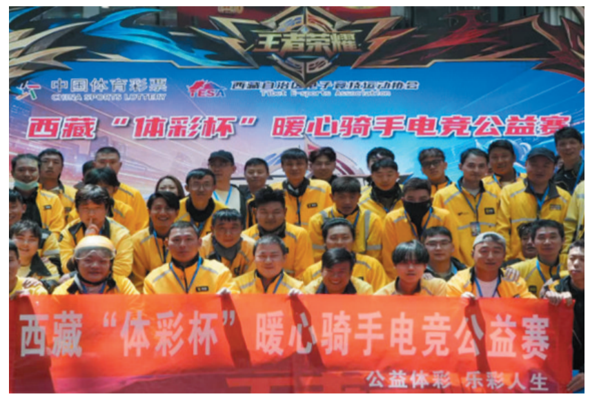
图为活动现场，外卖骑手合影留念。