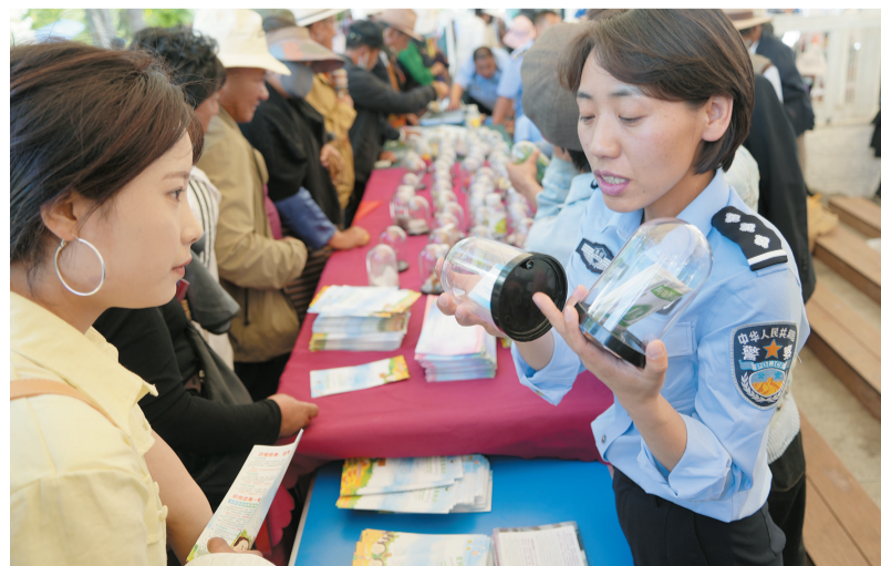
图为民警向市民讲解仿真毒品模型，普及禁毒知识。

拉萨融媒讯(记者小索朗曲珍)6月26日是第39个国际禁毒日。当日下午，拉萨市“6·26”国际禁毒日主题宣传活动在宗角禄康公园举行。活动以“筑牢禁毒安全防线 助力文明城市创建”为主题，深度融合禁毒宣传教育与文明城市创建工作，通过沉浸式、互动式宣传模式普及禁毒知识