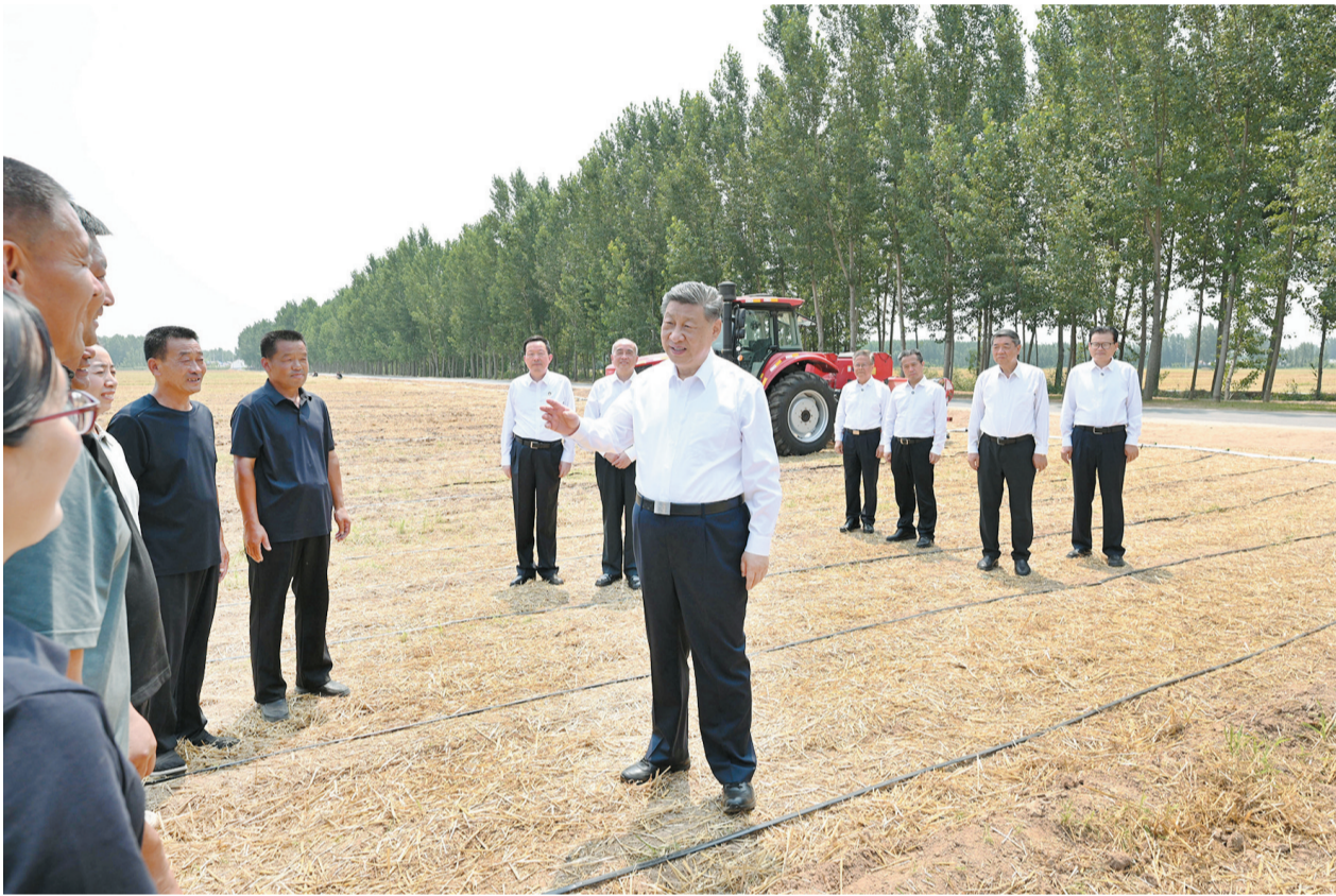
这是习近平在陵城区边临镇东于架村，走进农田同种粮大户、农机手、农技人员亲切交流。