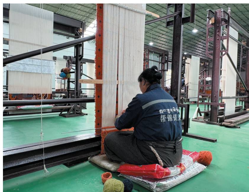
图为工人在编织藏毯。

编织区域内,工人端坐织架前,双手灵活翻飞,一根根绒线在经纬之间穿插缠绕。大家依照传统纹样精心勾勒,针脚细密均匀,每一道纹路都凝聚着手艺人的匠心。(下转第六版)