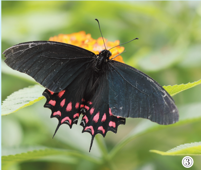
英国野生动物保护组织“蝴蝶保护协会”于6月12日公布英国最受欢迎蝴蝶评选活动的结果。 图①②为6月10日在英国伯肯黑德新渡口蝴蝶公园拍摄的一只绿帘蛱蝶。 图③为6月10日在英国伯肯黑德新渡口蝴蝶公园拍摄的一只粉斑牛心凤蝶。 图④为6月10日在英国伯肯黑德新渡口蝴蝶公园拍摄的一只环袖蝶。