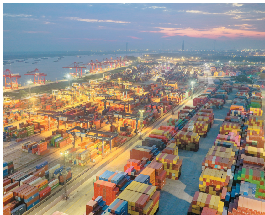
图为6月9日拍摄的江苏省港口集团南京龙潭港区（无人机照片）。

新华社北京6月9日电（记者邹多为）海关总署9日发布数据显示，今年前5个月，我国货物贸易进出口总值20.68万亿元，同比增速继续上行至15.3%，较前4个月加快0.4个百分点。其中，5月单月进出口4.45万亿元，同比增速较上月扩大2.7个百分点至16.9%。