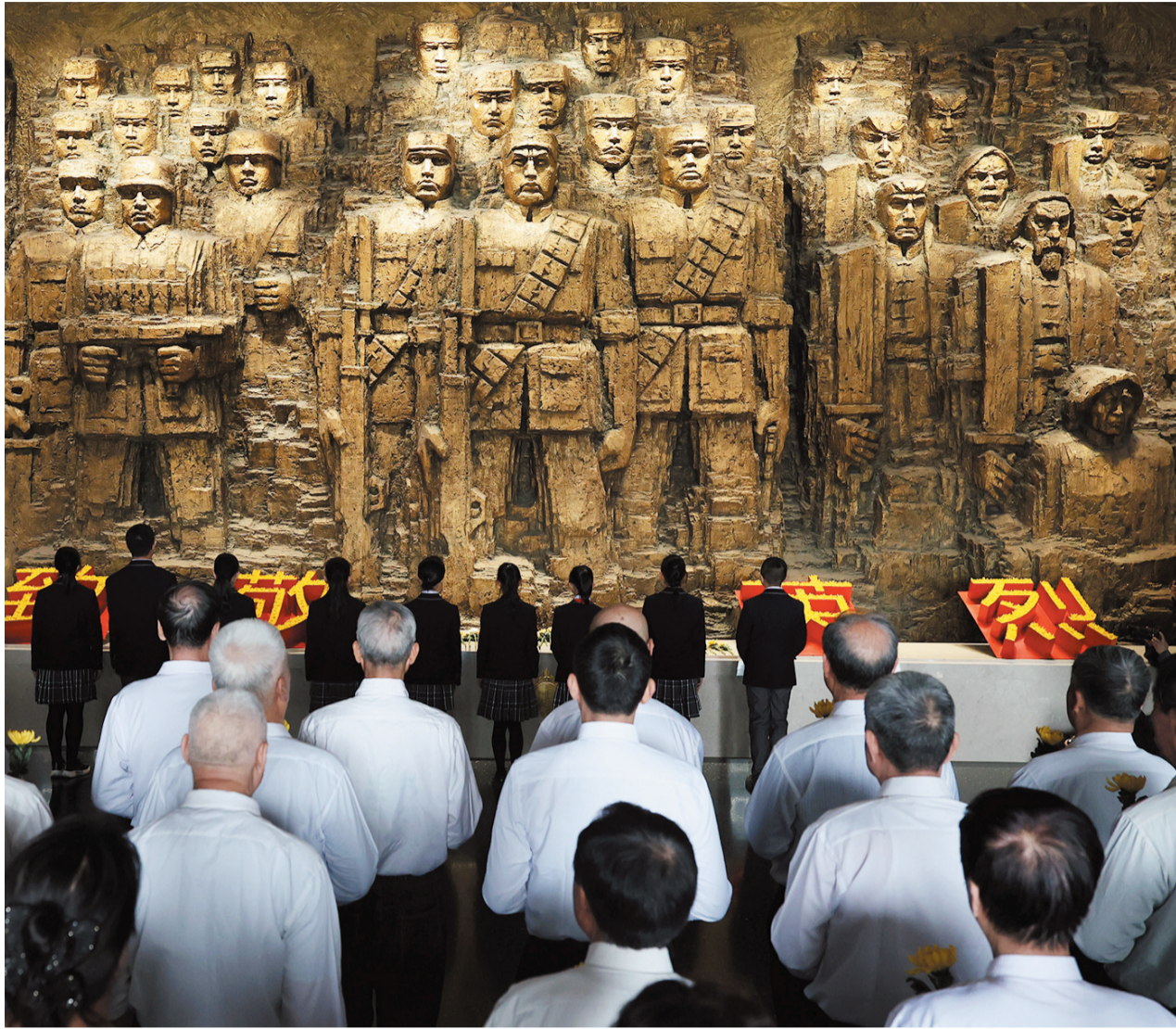
图为2026年4月3日，“清明节的铭记——缅怀英烈志奋进‘十五五’”主题教育系列活动启动仪式在中国人民抗日战争纪念馆举行。这是社会各界代表向抗战英烈献花。

人民抗日战争开展时间最早、持续时间最长。中国共产党多次呼吁世界上一切爱好和平民主的力量联合起来共同抵抗法西斯侵略，为世界反法西斯战争胜利作出重大贡献。