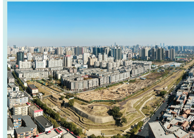
▲这是2025年11月21日拍摄的郑州商城遗址一隅(无人机照片)。

绿意葱茏的国家考古遗址公园内,市民们休闲怀古、触摸历史文脉;古老的夯土城墙下,一场场文旅活动融汇商都元素……保护与利用并进、城市与遗址共生。郑州商城遗址,已然从“藏在地下的遗产”变为“活在当下的文化”,给予现代郑州向新而行的力量。