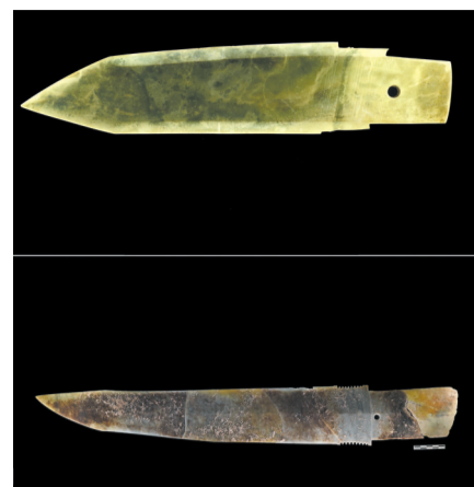
这是一张拼接照片:上图为二里头遗址出土的玉戈(中国社会科学院考古研究所二里头工作队提供);下图为郑州商城遗址出土的玉戈(郑州市文物考古研究院提供)。(新华社发)