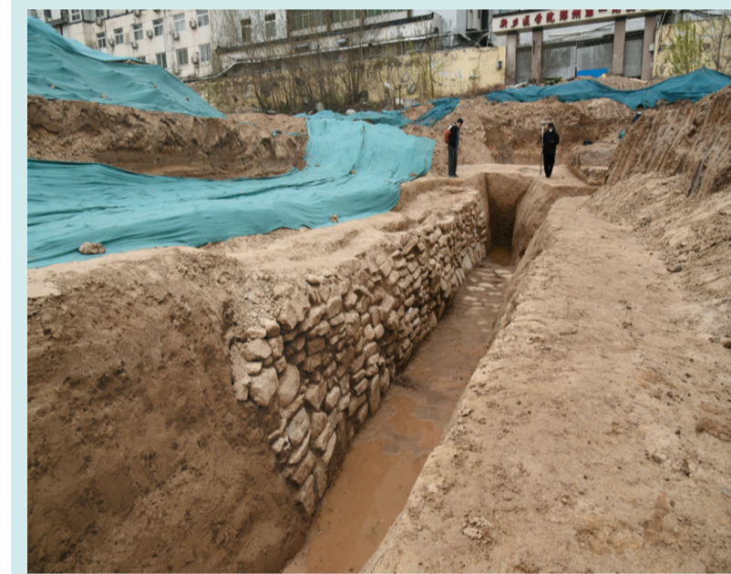
▲这是郑州商城遗址水系遗存中的石砌挡水墙(资料照片)。