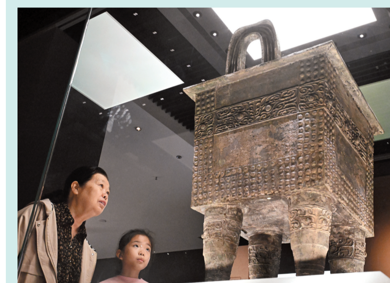
▲2025年10月3日,游客在“国宝回家乡——纪念郑州商城发现70周年考古新发现展”参观杜岭一号方鼎。