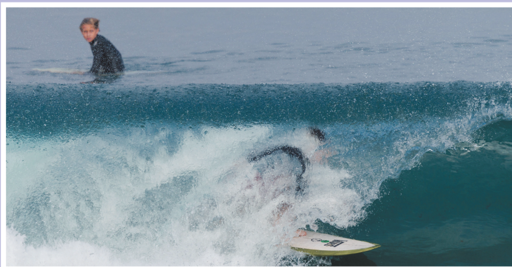
图为9月1日,人们在美国加利福尼亚州恩西尼塔斯的海滩冲浪。